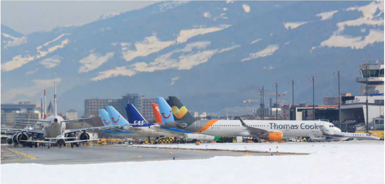
Ein Bild, das sich hoffentlich in Zukunft wieder öfter zeigt: Reger Betrieb am Innsbrucker Flughafen.

ment sehr gute Perspektiven hat; dieser Bereich wurde in den vergangenen Jahren ja bereits konsequent entwickelt und abgedeckt. Sehr Zukunfts-weisend scheint mir auch die aktuelle Performance der Allgemeinen Luftfahrt besonders im Segment der kommerziellen Luftfahrt mit Executive Jets zu sein. Dieser Bereich überstand Pandemie-Zeiten wesentlich besser als der Linien- und Charterflugverkehr und dürfte weiterhin mit Wachstumsperspektiven ausgestattet sein. Ganz grundsätzlich würde ich mir eine Entwicklung der Luftfahrt wünschen, die mehr die ökonomischen (mit Fliegen sollte wieder Geld verdient werden können, was nur durch ein angemessenes Preis/Leistungsverhältnis machbar ist), ökologischen (hier ist man mit Umwelt-freundlichen Luftfahrzeugen wie A320NEO, B737MAX oder EMB-E-Jets bereits auf einem sehr guten Weg, auch mit entsprechender Akzeptanz durch Flughafenanrainer) und sozialen Ziele (die hoch-qualitative Arbeit in der Luftfahrt muss entsprechend entlohnt werden) im Sinne der Nachhaltigkeit im Fokus hat, mit Gültigkeit für die gesamte Produktionskette der Luftfahrt.