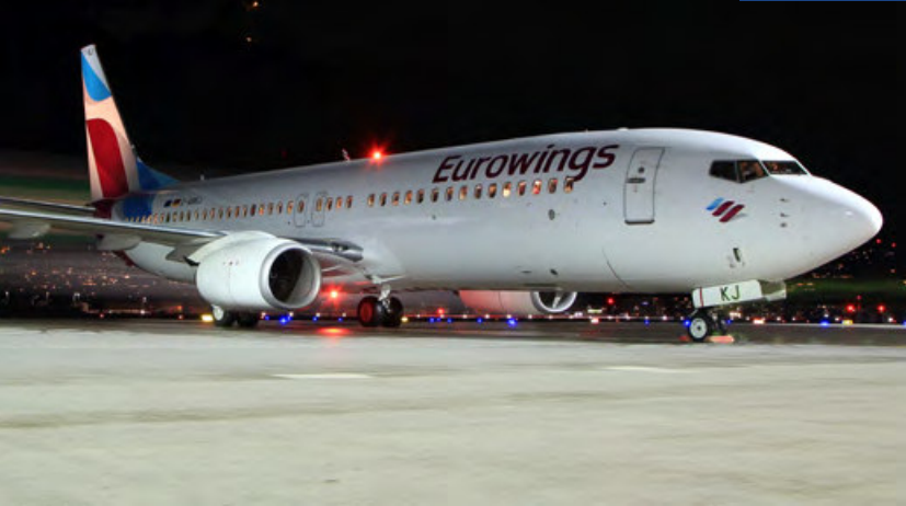
D-ABKJ · Eurowings · Boeing 737-800