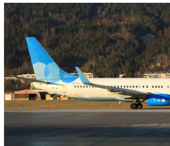
VQ-BTG · Pobeda · Boeing 737-800

WEITERE BILDER AUS DER WINTERSAISON 2019/20