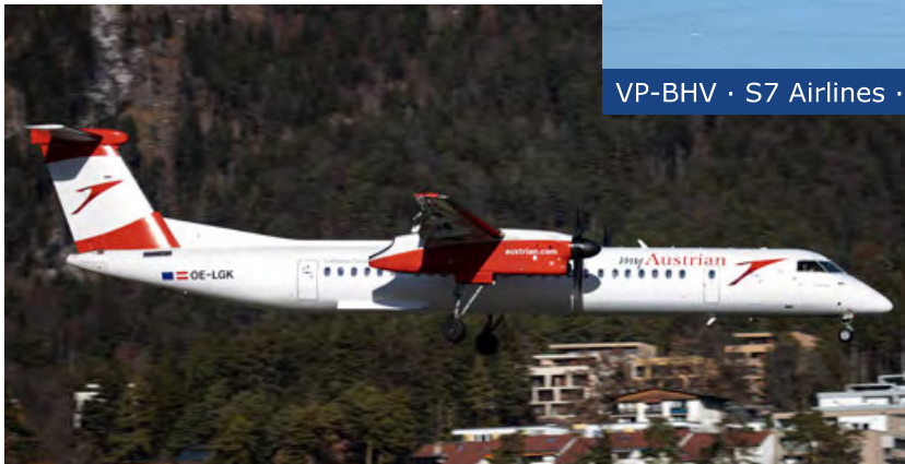
OE-LGK · Austrian Airlines · Dash 8-400