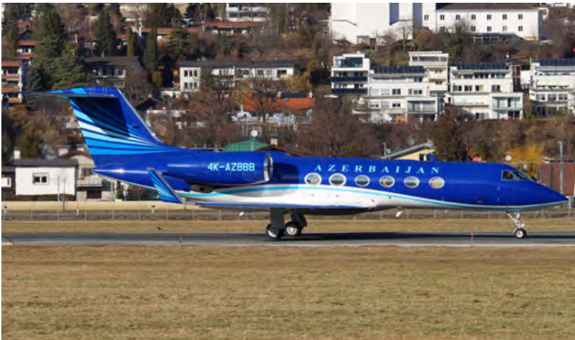
4K-AZ888, GOV of Azerbaijan, Gulfstream G450