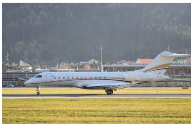
Bombardier Global Express.

Dassault Falcon 900EX EASy (VP-BOZ) 2008 – 2009.