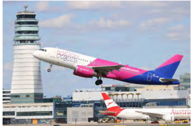
Airbus A321 (HA-LWB) der ungarischen Wizz Air

November ein weiteres Flugzeug, einen neuen A321neo stationieren. In weiterer Folge werden alle bisherigen fünf A321 von A321neo aus den Beständen des Unternehmens ausgetauscht um „nicht nur die Kosten pro Flug zu senken, sondern auch um die Kapazitäten zu erhöhen“, so Carey.