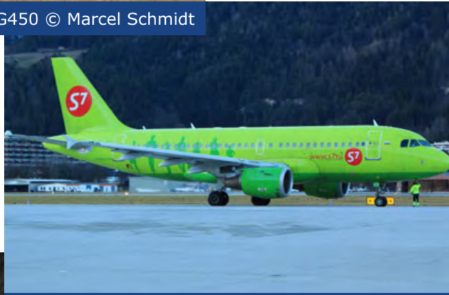
VP-BHV · S7 Airlines · Airbus A319