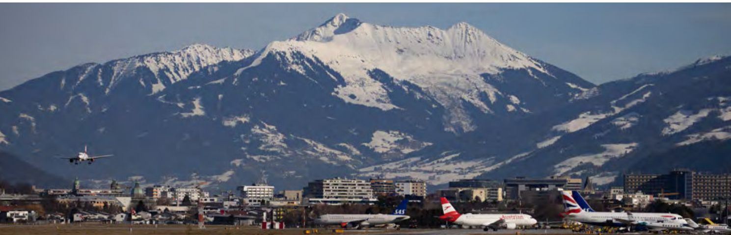
Die Wintersaison 2019/20 begann sehr vielversprechend und bescherte dem Flughafen Innsbruck in den ersten Monaten einen regen Flugbetrieb.