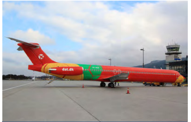
OY-RUE · Danish Air Transport · Douglas MD-83