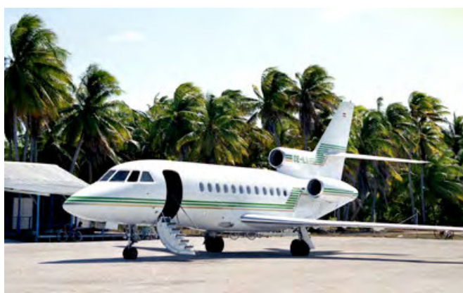
Falcon 900 auf Christmas Island.

neue Möglichkeiten: Südatlantik, Hawaii, die Südsee und Japan über Sibirien waren jetzt erreichbar. Spektakuläre Langstreckenflüge waren folglich zu verzeichnen. Zum Beispiel von Innsbruck aus über den Südatlantik nach Venezuela und Südchile oder für einen auf der Nordkette verunglückten Japaner ab Innsbruck nach Tokyo. Bemerkenswert dabei die Tatsache, dass (noch vor der AUA) die erste Überfluggenehmigung für ein österreichisches Flugzeug über Sibirien erteilt wurde. Mit besonderem Stolz kann auf den Auftrag einer amerikanischen Versicherung verwiesen werden, die den Transport eines amerikanischen Patienten von Bangkok nach Chicago mit Falcon 900 veranlasste. Aber auch die Überstellung zweier Intensivpatienten von Hawaii nach Graz, mit nur einer Zwischenlandung in den USA, war eine Herausforderung.