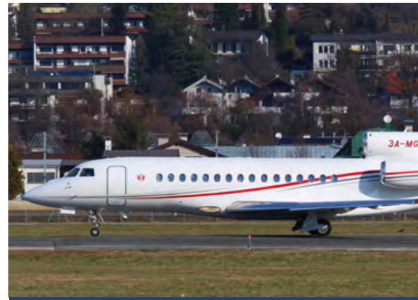
3A-MGA · GOV of Monaco · Dassault Falcon 8X