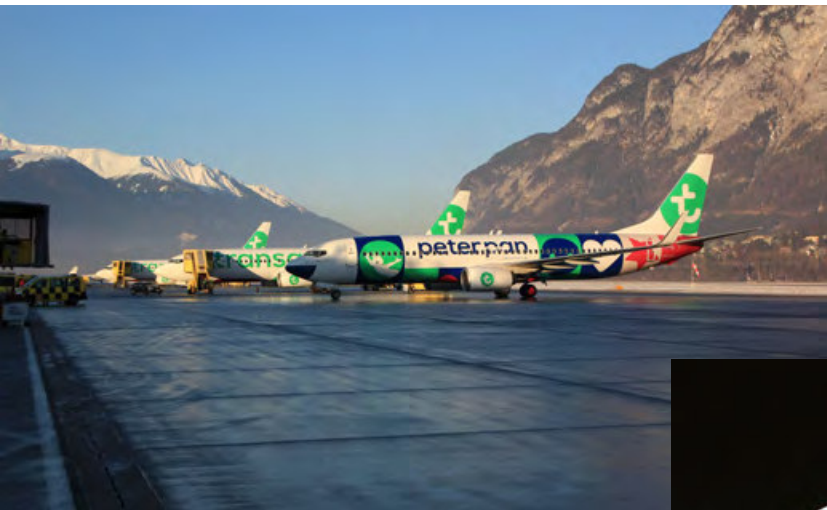
3 Transavia · Boeing 737-800