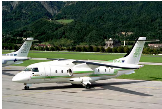
Do 328 Jet (OE-HTJ).

ce (TAA) übertragen wurden. Jedoch wurden bereits im Jahr 2000 eine Cessna Citation VII (OE-GLS) und eine Executive Dornier 328 JET-310 (OE-HMS) 2000-2015 angeschafft. Dieses Flugzeug konnte, so wie der Dornier 328 Jet-310 (OE-HTJ) 1999-2013 mit verschiedenen Sitzkonfigurationen (19, 26, 29 oder 31 Sitze) ausgestattet werden und stand für Flugbereitschaft wie Charterkunden im Einsatz.