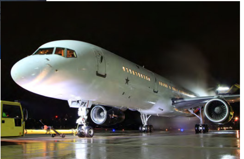
G-ZAPX · Titan Airways · Boeing 757-200