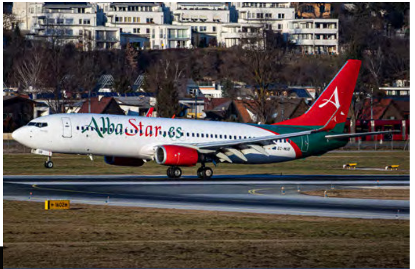
EC-MUB · Albastar · Boeing 737-800