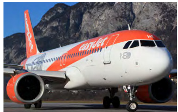
G-UZHE · easyJet · Airbus A320neo