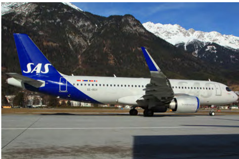
SE-ROY · SAS · Airbus A320neo